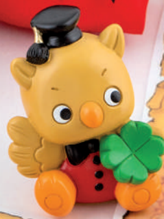
AC 300/R + AC 30