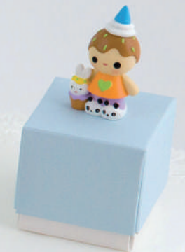
CAB 801 (SOLO RESINA)