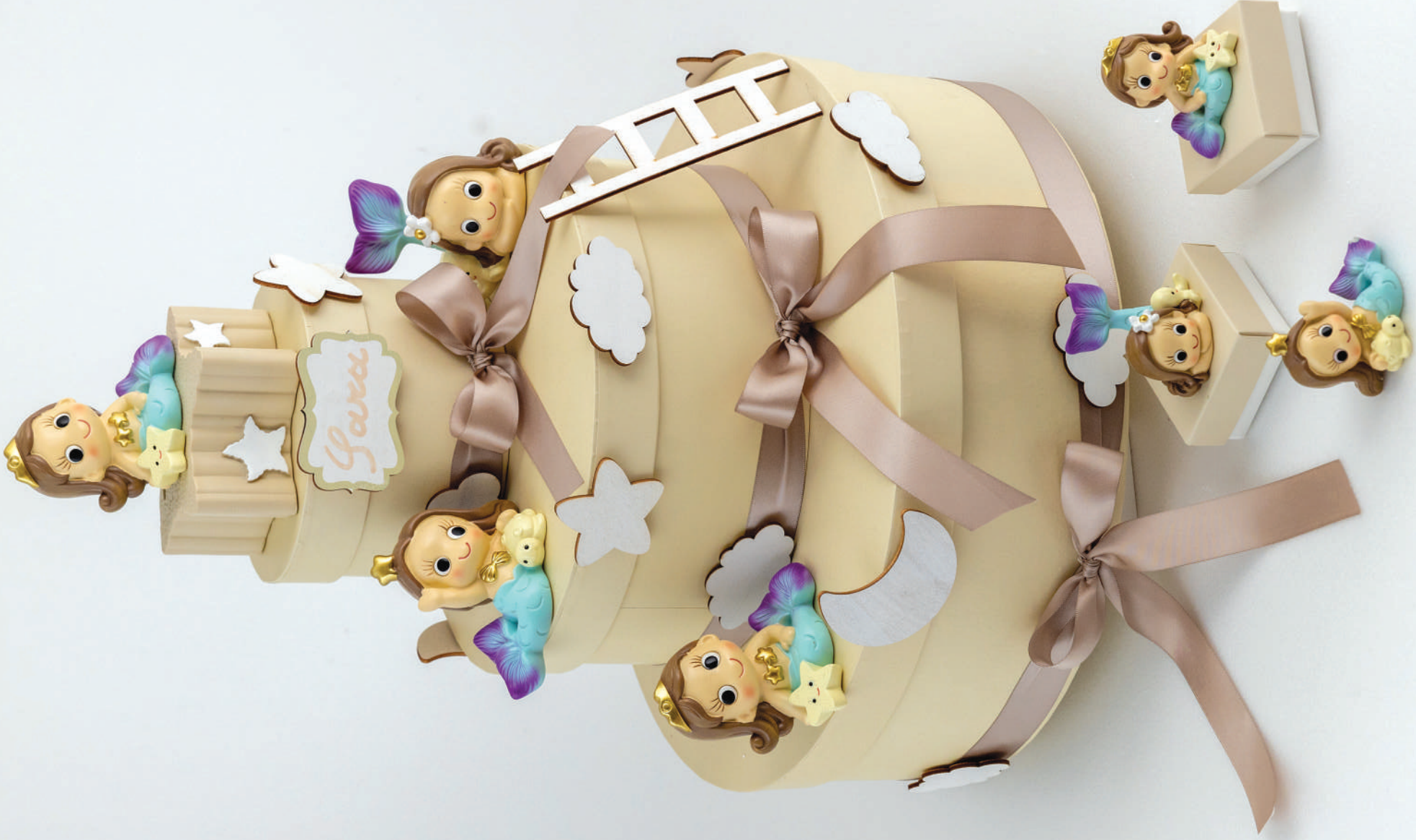
ESEMPIO DI COMPOSIZIONE