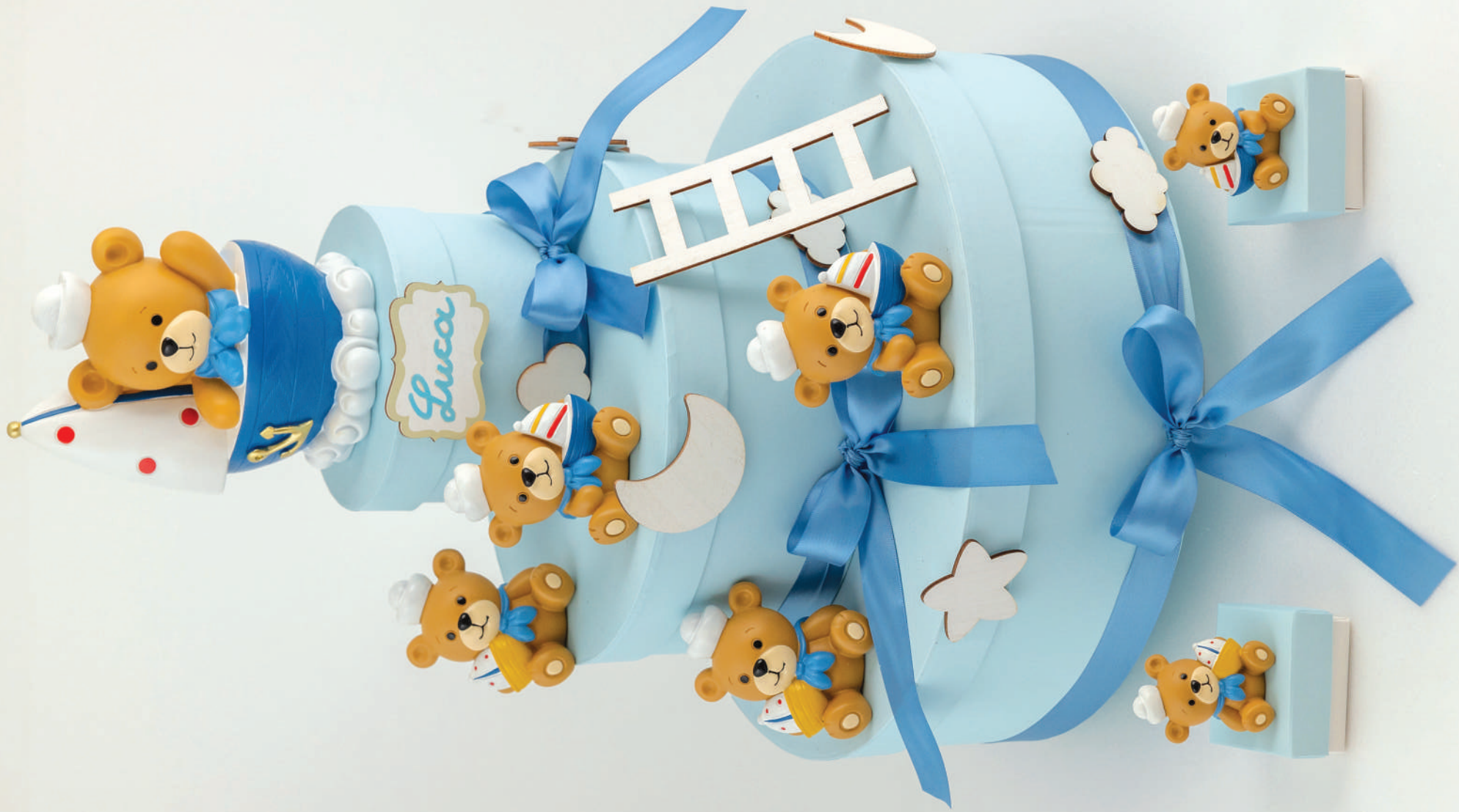
ESEMPIO DI COMPOSIZIONE