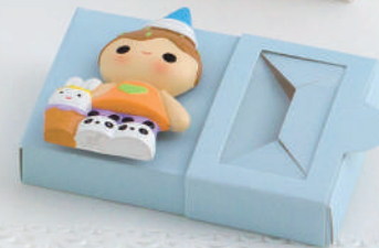
CAB 806 (SOLO CALAMITA)