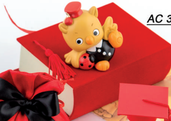
AC 320/R + AC 32