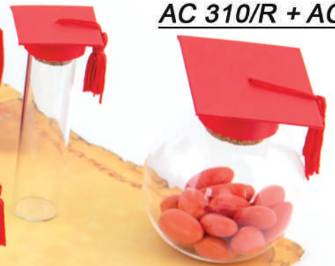
AC 310/R + AC 31